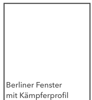
Berliner Fenster mit Kämpferprofil