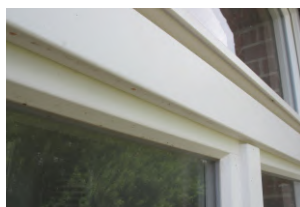
Berliner Fenster Standard ohne Kämpferprofil