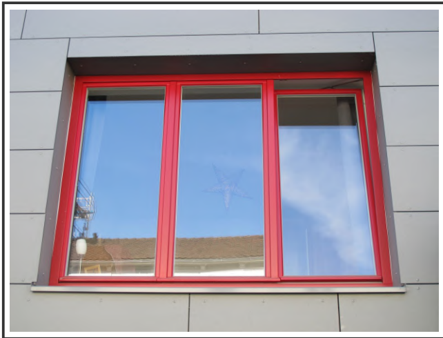
DREITEILIG MIT STULP | DREH-KIPP-BESCHLAG

www.fecon-nordwest.de info@feccon-nordwest.de