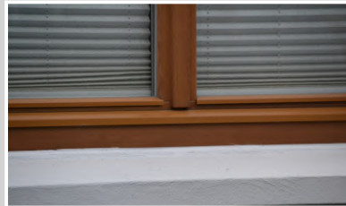
Alu-Regenschiene & Flügelabdeckprofil