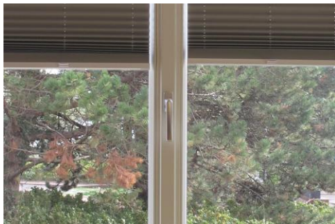
Berliner Fenster mit Schlagleistengetriebe symmetrische Innenansicht