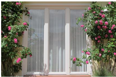
Dreiteilig mit Pfosten